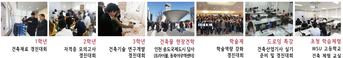
1학년 건축재료 경진대회 2학년 자격증 모의고사 경진대회 3학년 건축기술 연구개발 경진대회 건축물 현장견학 인천 송도국제도시 답사 (트라이블, 동북아무역센터) 학술제 학술역량 강화 경진대회 드로잉 특강 건축산업기사 실기 준비 및 경진대회 초청 학습체험 WSU 고등학교 건축 체험 교실