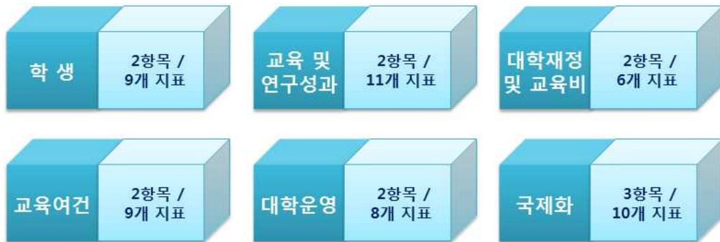
[그림 3-1] 자체평가 모형의 구성도